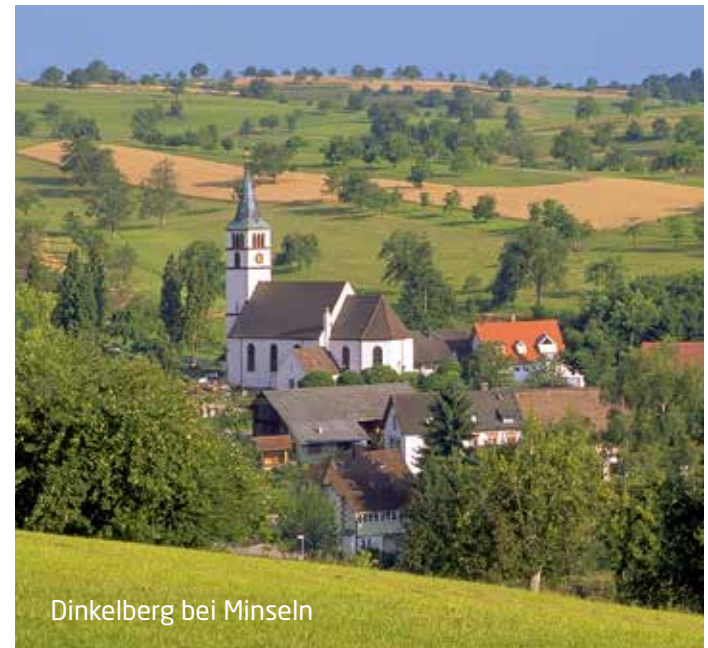
Dinkelberg bei Minseln