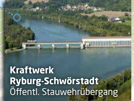
Kraftwerk Ryburg-Schwörstadt Öffentl. Stauwehrübergang