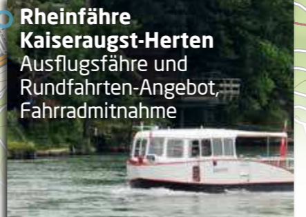
Rheinfähre Kaiseraugst-Herten Ausflugsfähre und Rundfahrten-Angebot, Fahrradmitnahme