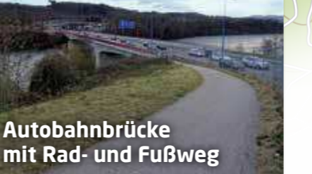
Autobahnbrücke mit Rad- und Fußweg