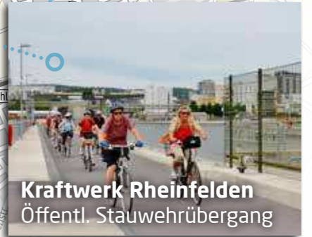
Kraftwerk Rheinfelden Öffentl. Stauwehrübergang