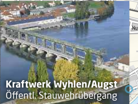
Kraftwerk Wyhlen/Augst Öffentl. Stauwehrübergang