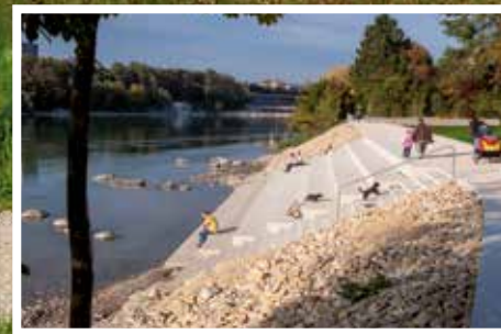
Rheintreppe L'escalier à bord du Rhin