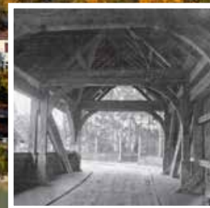
Die ehem. Holzbrücke (bis 1897) Le vieux pont en bois (jusqu'en 1897)