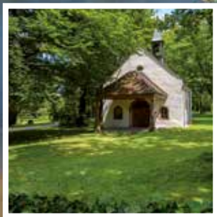
Stadtparkkapelle La chapelle dans le parc municipal

A l'époque, l'achat des espaces nécessaires à la création d'un vaste parc destiné tant aux hôtes de l'hôtel qu'aux curistes a empêché l'implantation d'un complexe industriel à cet endroit. Aujourd'hui, un parc municipal, ouvert au public a remplacé le parc réservé aux curistes. On y trouve de superbes arbres, un étang artificiel et un pavillon convivial. A l'est de ce dernier, l'extension récente du parc permet un accès direct au Rhin. On y a implanté de longues marches descendant jusqu'à l'eau, une place de jeux, parcours de fitness et des aménagements écologiques.