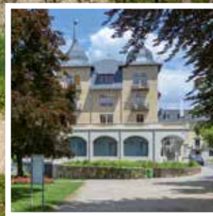
Ehem. Grand Hotel des Salines L'ancien Grand Hôtel des Salines