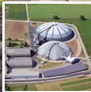
Saldome 1 und 2 der Rheinsalinen Saldomes 1 et 2 des Salines Suisses