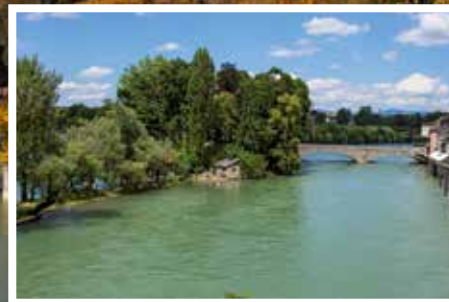
Burgstell und Inseli La petite île

Übersichtskarte auf den Seiten 28/29 Plan de situation sur les pages 28/29